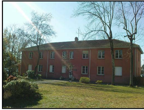
L'Hospitalisation A Domicile